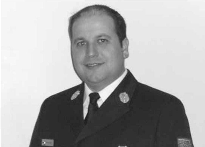
Markus Barnsteiner, der neue Kreisbrandrat für den Landkreis Ostallgäu.