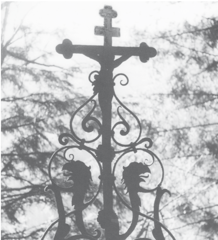
Auf Drachensuche - wer weiß, wo dieses Kreuz mit den Drachenköpfen steht?