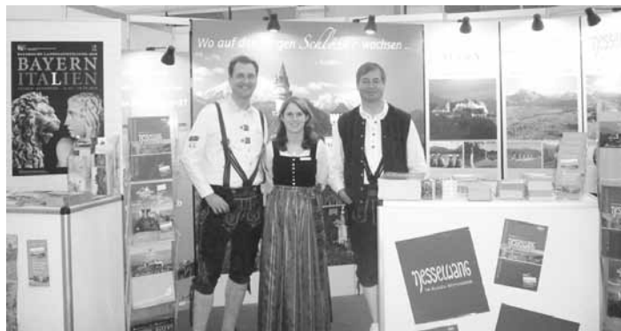
Messestand bei der Ferienmesse Bern/Schweiz Gästeehrungen im Januar 2010