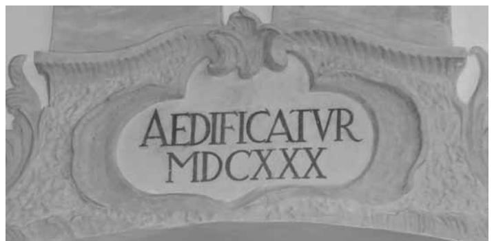
„Erbaut 1630“ – eine kleine Übersetzungsübung vom Lateinischen für die Erstkommunionkinder