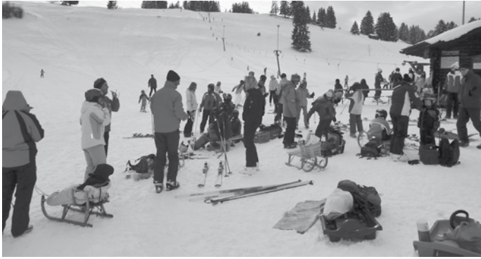
Endlich Schnee - Endlich wieder was los an der „Alten Reuthe“