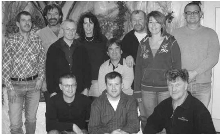
Die Vorstandschaft des MSC Roßhaupten