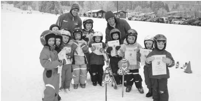
Stolz zeigen die Kinder des Anfängerschikurs Ihre Urkunden