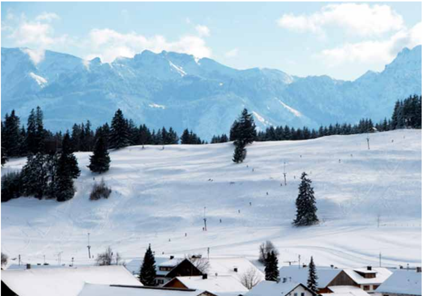
Endlich genügend Schnee für unser „Ski- und Langlauf-Eldorado am Fuße der Alpen“