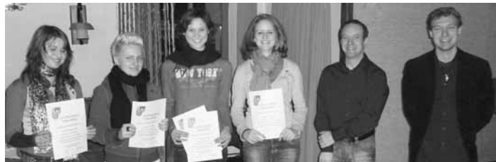
Urkunden für erfolgreiche Bläserkurse erhielten (von links nach rechts):