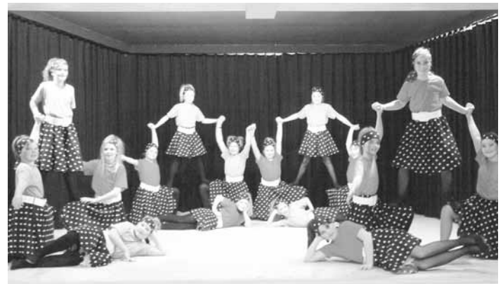
Die Rock'n Roll Girls im Einsatz