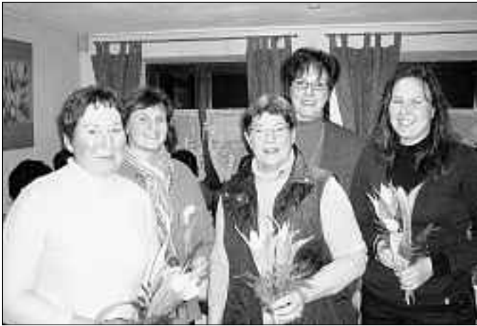
Mit Blumen verabschiedet