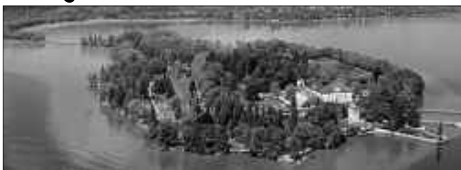
Insel Mainau im Bodensee

Der diesjährige Ausflug der Veteranen- und Soldatenkameradschaft führt am Samstag, 06. Juni zur Insel Mainau.