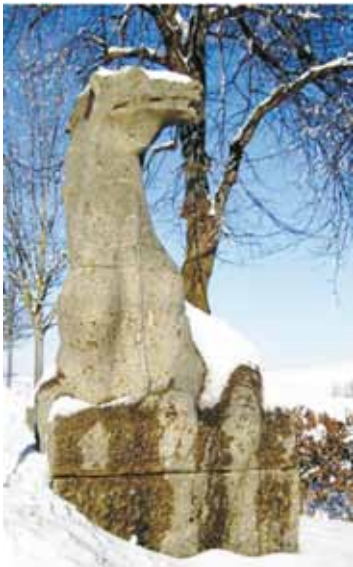
Der Drache wird zum neuen Logo von Roßhaupten und der Drachenweg entsteht.