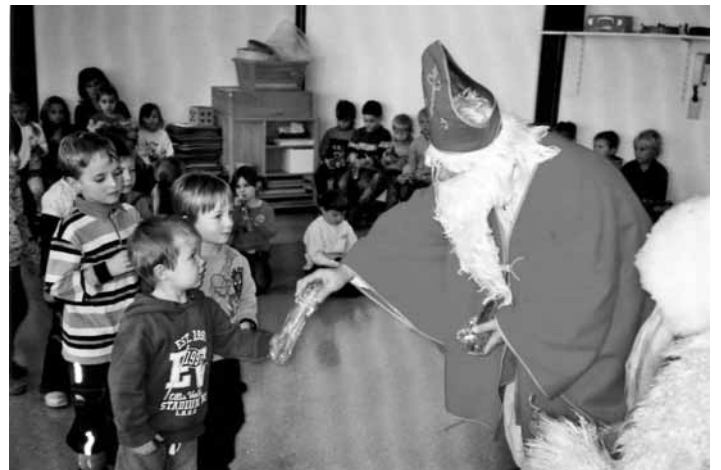
Besuch vom Nikolaus im Kindergarten - da wurden die Augen der Kinder groß und Geschenke gab es auch noch!

In diesem Jahr war alles etwas anders: Es regnete in Strömen