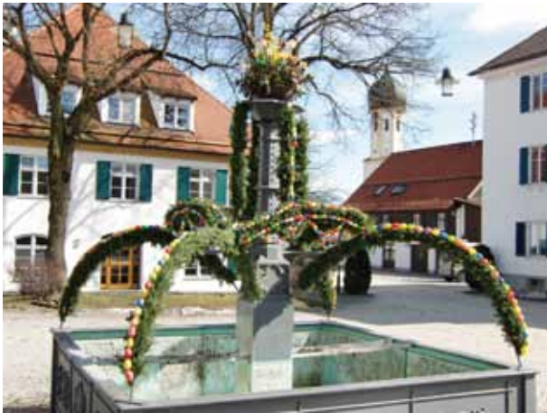
An Ostern zierte ein wunderschöner Osterbrunnen den Dorfplatz