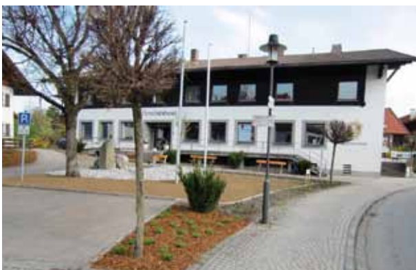
Der Gemeindegarten wird Renoviert