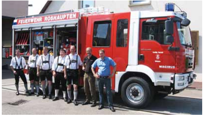
Das neue Löschfahrzeug wurde abgeholt