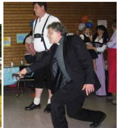
Und beim Pfarrfest durfte man etwas anderst als sonst kegeln!