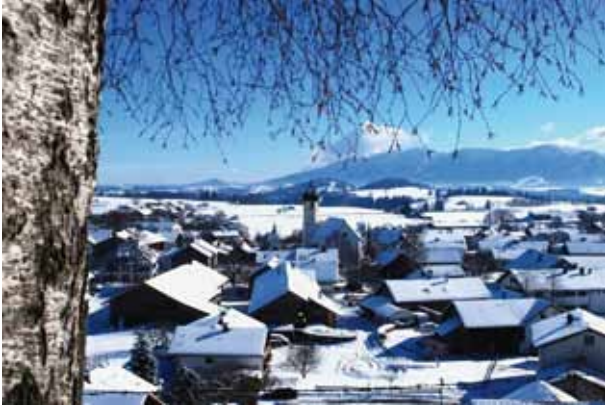
Ein herrlicher Winterblick auf Roßhaupten!