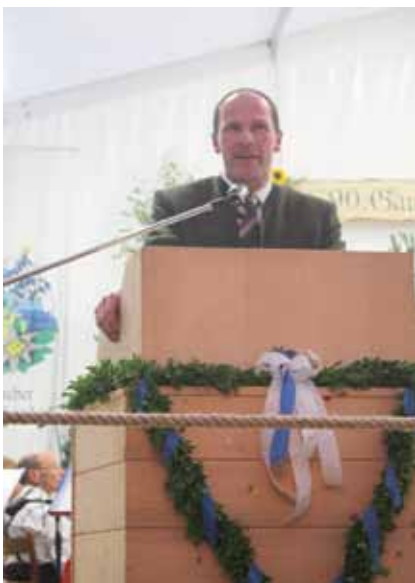
Das Gautrachtenfest des Trachtenvereins wurde ein voller Erfolg