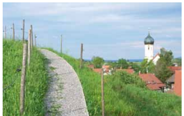
Ebenso der Leitenweg