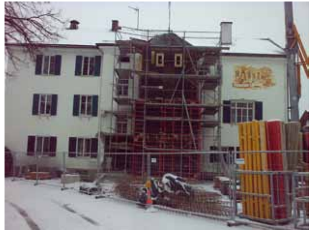
Die Renovierung der „alten Schule“ ist in vollem Gange