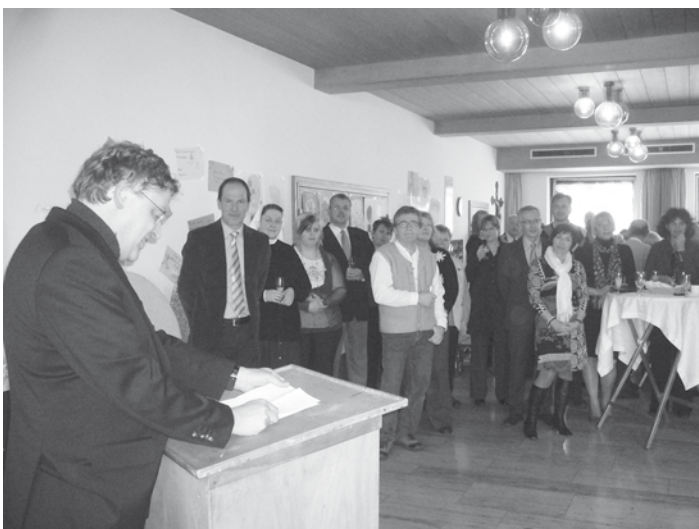
Gute Stimmung beim Neujahrsempfang der politischen und kirchlichen Gemeinde in Roßhaupten