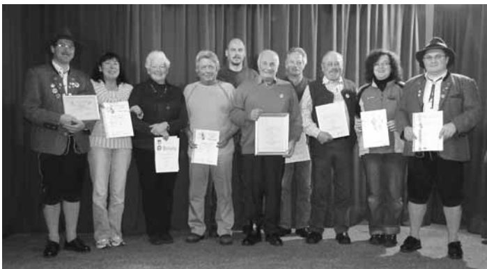
unsere erfolgreichen Schützen und Ehrungen

Bei der Jahreshauptversammlung des Schützenverein 1875 Roßhaupten wurden folgende Schützen für Ihre Erfolge bei der Gaumeisterschaft sowie für Ihre langjährige Mitgliedschaft geehrt (siehe Bild v.l.n.r.):