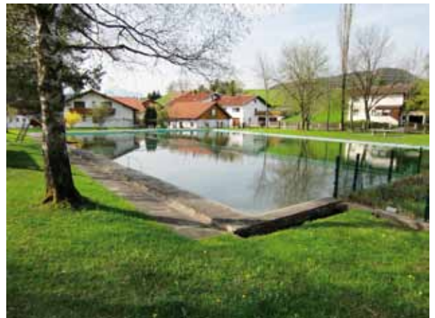
Das Wettebad erhält einen neuen Pächter