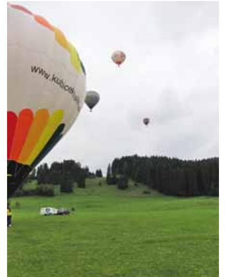
Auch das Ballonfahrertreffen konnte stattfinden