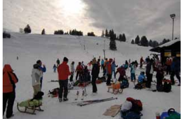
Hoffentlich können wir heuer auch noch Skifahren!