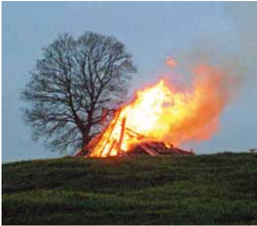
Das Maifeuer loderte am 30. April 2010