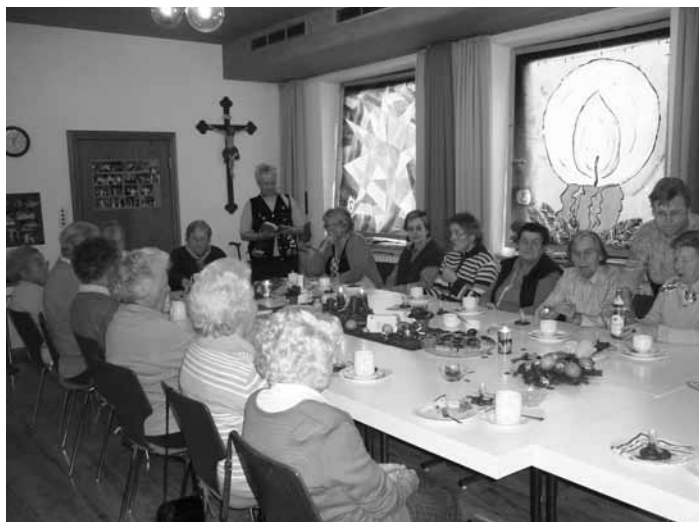
Gute Unterhaltung beim Aktiv-Nachmittag für Senioren