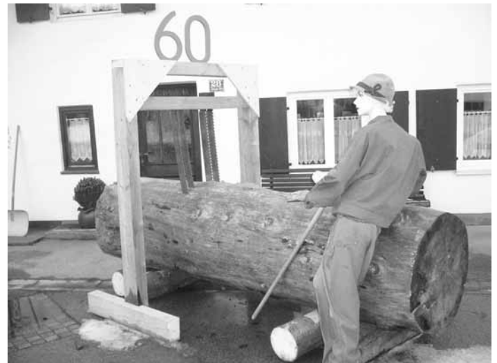
So ist es, wenn ein Sägewerker 60 wird, dann steht plötzlich die Arbeit vor der Tür. Alles Gute auch vom Redaktionsteam.