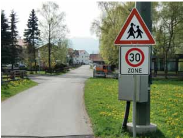
Die Zone 30 wird in Roßhaupten eingeführt