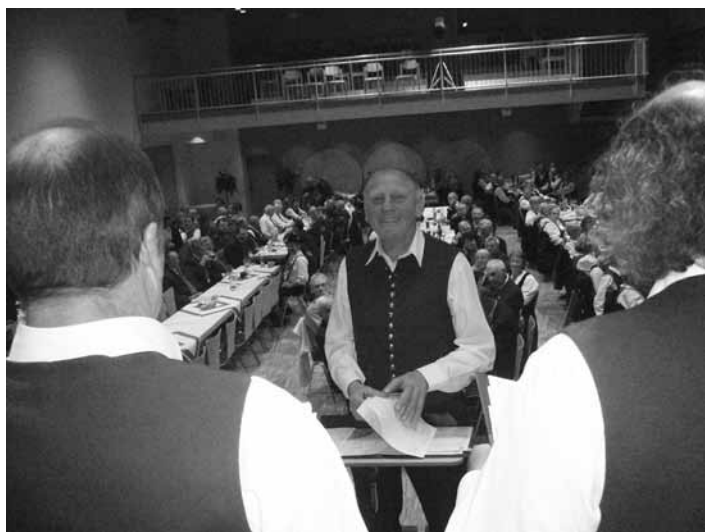
Ein unterhaltsamer Abend mit dem Männerchor und dem gemischten Chor beim Sängertreffen in Seeg