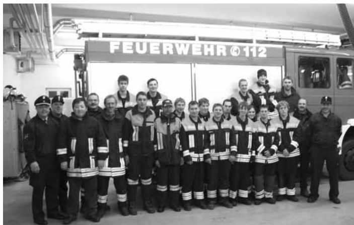
Stolze Gesichter nach bestandener Leistungsprüfung.