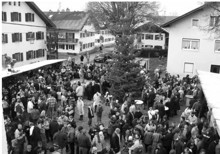
Endlich wieder Adventsmarkt – am Samstag, 27.11. ist es wieder soweit