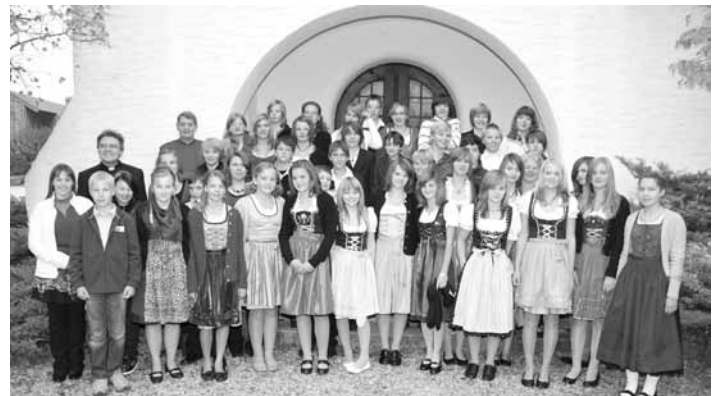
42 Jugendliche empfingen das Sakrament der Firmung in Roßhaupten