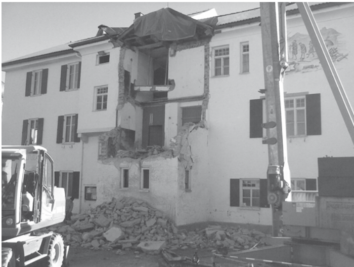
Mit dem Abbruch des baufälligen alten Vorbaus begann jetzt die Sanierung unserer Alten Schule am Dorfplatz