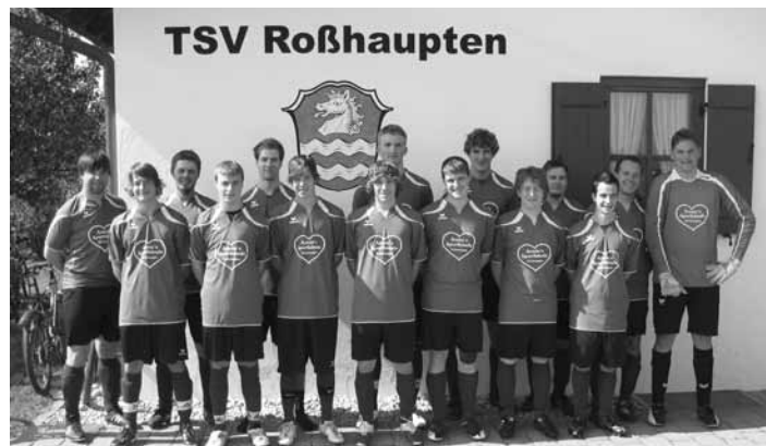
Auch die 2. Mannschaft präsentiert ihre neuen Trikots, gesponsert von Armin's Sporthäusle

Robert Högner Bauunternehmen sponsert die neuen Trikots für die 1. Mannschaft des TSV Roßhaupten. Im Moment befinden sich unsere Fußballer am 2. Spieltag der Rückrunde auf dem 4. Platz in der Tabelle. Auch die 2. Mannschaft des TSV durfte sich über neue Trikots freuen. Armin's Sporthäusle spendierte der 2. Mannschaft das neue Trikot. Die 2. Mannschaft belegt Platz 5 der Tabelle. Ein recht herzliches Dankeschön an die beiden Sponsoren. Wir hoffen auf eine verletzungsfreie Rückrunde mit fairen Spielen und hoffentlich vielen Siegen.