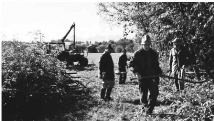
Die Seniorengruppe im Einsatz

Nach längerem Stillschweigen möchte sich auch die im Jahr 1994 gegründete Seniorengruppe wieder einmal zu Wort melden. Entstanden ist dieses Team damals aus der Arbeitsgruppe Ökologie im Arbeitskreis Dorferneuerung. Waren es anfangs hauptsächlich Pflanzungen entlang unserer Bäche und Wirtschaftswege, so sind wir heute meist mit der Pflege dieser Anlagen beschäftigt. Die Hecken und Uferstreifen, wie etwa am Gruberbach südlich und nördlich der Kläranlage, explodieren förmlich. Sie möchten nach oben durchgehen. Der Zweck wäre dann verfehlt. Die angrenzenden Wiesen würden zu sehr beschattet werden, die heckenbildenden Sträucher würden kümmern. In den dichten Teilen stellte sich bereits eine bunte Vogelwelt ein. Seit der Uferbepflanzung am Gruberbach kann erfreulicherweise ein seltener Schnepfenvogel - die Bekassine - regelmäßig angetroffen werden. Auf dem Bild ist unsere Gruppe bei der letzten Aktion im Oktober am Gruberbach zu sehen. Ein alljährliches Arbeitsfeld bedeutet für uns der Kinderspielplatz in der Raiffeisenstraße. Die vor 14 Jahren für Tunnel und Tipi gepflanzten Weiden mussten schon vor einiger Zeit auf den Stock gesetzt - d.h. bodeneben abgeschnitten - werden. Sie waren anders nicht mehr zu bändigen. Die Stöcke treiben jährlich über zwei Meter hohe Ruten. Dieses verflochten fleißige Mütter zu einer Spielelandschaft, zur Freude der Kinder. Wir entnehmen die mehrjährigen Ruten, damit immer wieder junge Triebe nachwachsen können. Der seit einigen Jahren grassie-