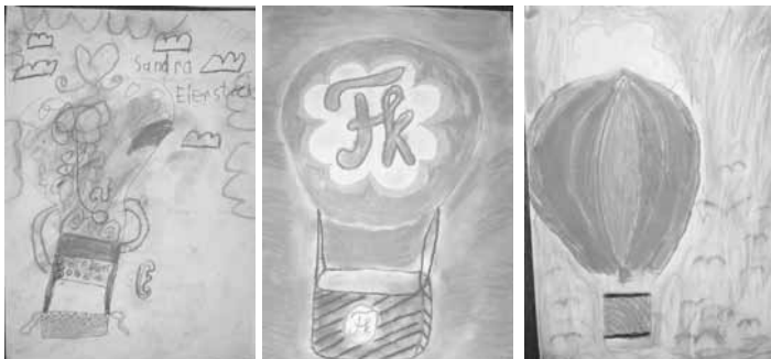
Die Siegerbilder des Malwettbewerbs beim Ballonfahrertreffen