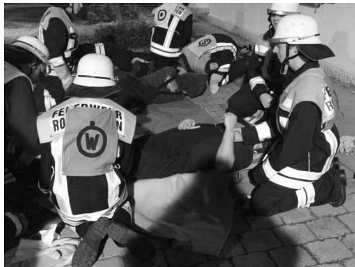
Bei der Truppmannprüfung muss auch Erste-Hilfe angewendet werden können!

Die Nachwuchsgruppe der Feuerwehr Roßhaupten hat zum Ende der zweijährigen Truppmannausbildung ihre Kenntnisse in einer theoretischen und praktischen Prüfung abgelegt. Die Prüfung wurde unter Aufsicht von zwei Schiedsrichtern in Roßhaupten durchgeführt. Der praktische Teil wurde als kleine Einsatzübung geprüft. Hier wurde angenommen, ein Gebäude drohe einzustürzen und die sich darin befindenden Personen mit verschiedenen Verletzungsmustern galt es