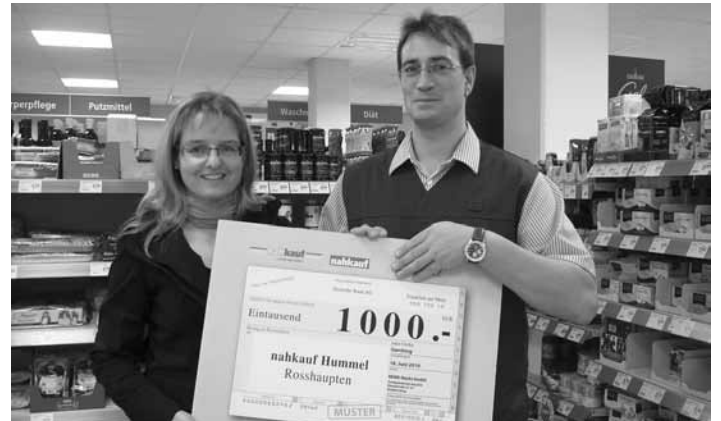
Große Freude über die Spende des Nahkauf Hummels an das MGH