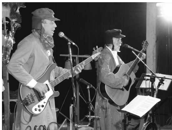
Bei der „Königlich privilegierten Waschhausvereinigung“ flossen die Lachtränen in Bächen