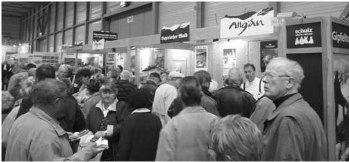
großer Andrang bei Stand des Südlichen Allgäus auf der Caravan und Reisemesse in Erfurt