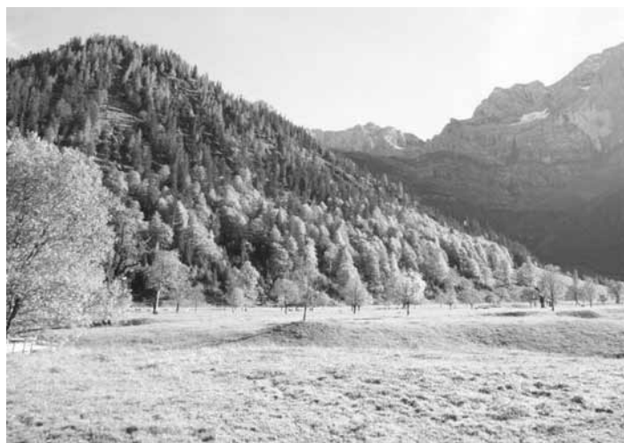
Eine wunderschöne Landschaft entdeckte der Frauenverein bei seinem Ausflug zum Großen Ahornboden

Am 6. Oktober, bei strahlendem Sonnenschein, fuhr der Frauenverein zum Großen Ahornboden in der Eng. Er liegt in Tirol und die Zufahrt ist nur über Bayern möglich. Schon die Fahrt am Sylvensteinspeicher entlang, rechts und links die buntgefärbten Berghänge, war grandios. Es ist ein Naturdenkmal im zentralen Karwendel und liegt auf 1200 m Seehöhe. Einige