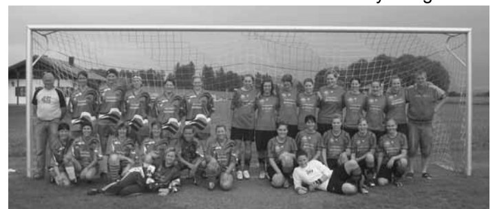
Beide Mannschaften beim gemeinsamen Gruppenbild