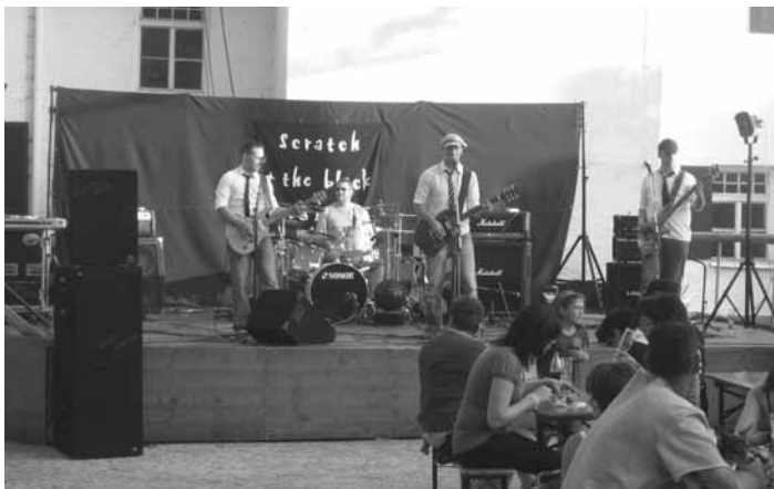
Scratch and the black souls heizen bei Rock am Maibaum mächtig ein!