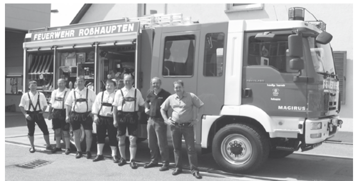
Das neue LF10/6 A AF3 der Feuerwehr Roßhaupten und die Abholdelegation vor der Abfahrt im Werk Weisweil.