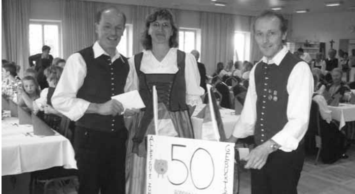
Die Sänger gratulieren ihrem Vorstand