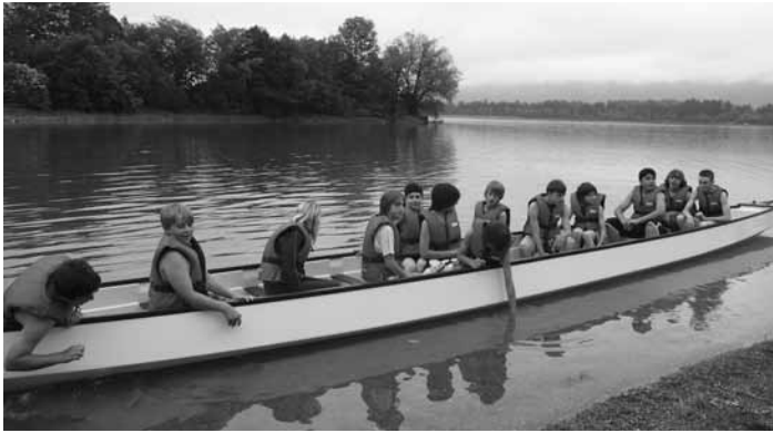
Drachenboot begeistert die 7a der Hauptschule Roßhaupten