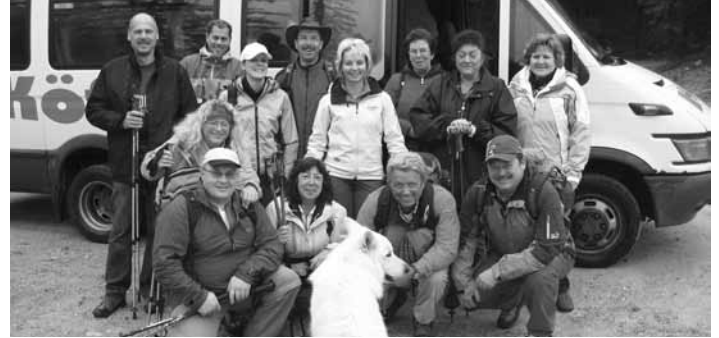
Ausflug zur Vilseralm - trotz Regen gabs viel Spass!