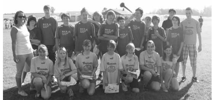
7. Klasse der Hauptschule Roßhaupten