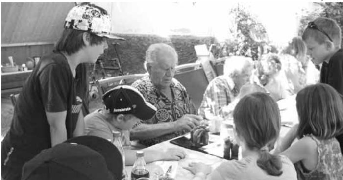
Mensch ärgere dich nicht kommt immer gut an, bei Jung und Alt.