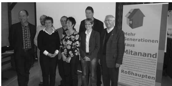
Die Vorstandschaft des Förderverein „MGH Mitanand“