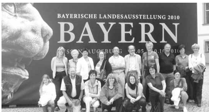
Roßhauptener Vermieter bei der Landesaustellung in Füssen

Kompetente Wissenschaftlerinnen führten die Mitglieder des Tourismusvereins durch die Landesaustellung. Sind die Gebäude des ehemaligen Klosters St. Mang an sich schon sehenswert, so sind die Räumlichkeiten mit der Landesaustellung optimal genutzt und bieten einen Überblick über die Beziehungen von Italien und Bayern durch die Jahrhunderte. Angefangen bei den Römern und ihrer Via Claudia Augusta über die Langobarden bis zu den Welfenkönigen und Kurfürst Maximilian reichen die Verbindungen. „Man kann die Fülle an Informationen auf einmal gar nicht verarbeiten. Da muss man noch einmal kommen!“ war der einhellige Tenor der beteiligten Roßhauptener Vermieter.