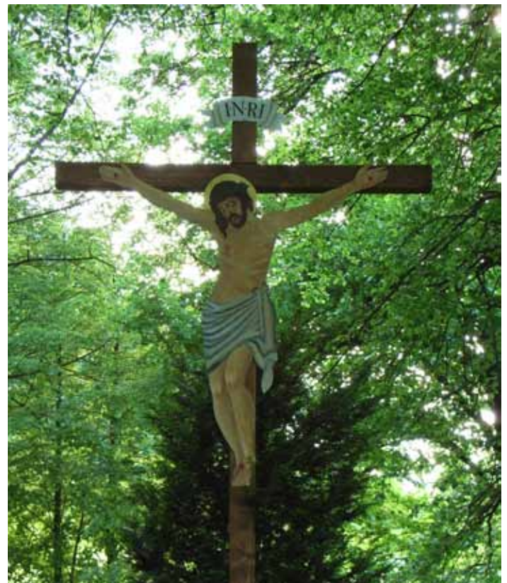
Damit die Erinnerung nicht „verblasst“: das frisch sanierte Holzkreuz im Pestfriedhof. Ein herzliches Dankeschön an Pankraz Walk und den Bauhof für die gelungene Sanierung!