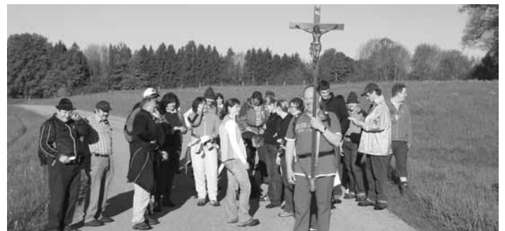
Trachtler bitteten bei der Wallfahrt um einen unfallfreien und glücklichen Verlauf des Gaufestes