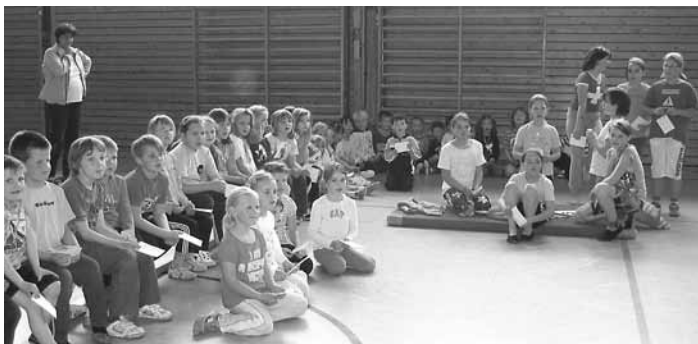
Saisonsabschluss beim Kinderturnen