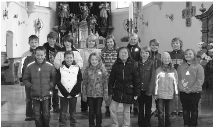
Die Kommunionkinder 2010 nahmen begeistert an den Weggottesdiensten teil und wurden bestens auf die 1. hl. Kommunion vorbereitet.