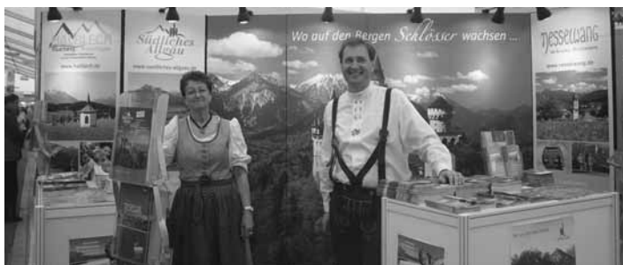
Auch Roßhaupten war auf dem Mannheimer-Maimarkt vertreten.