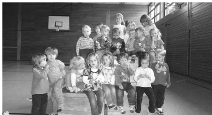
Zum Saisonende des Mutter-Kind-Turnen 2009/2010 strengten sich beim abschließenden Parcour nochmal alle kräftig an und erhielten zur Erinnerung eine Urkunde und eine kleine Überraschung.