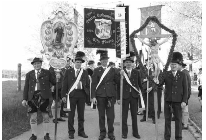
Als Ausrichter des Gautrachtenfestes durfte der Trachtenverein die Wahlfahrtsstange des Oberen Lechgau tragen.