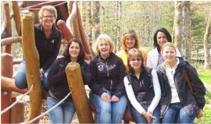
Gute Stimmung beim Muttertagsausflug

Dieses Jahr hatten sich einige Roßhauptener Mamas für ihren Muttertagsausflug den Beichelstein ausgesucht. Nach einem gemütlichen Fußmarsch wurde der neue Waldspielplatz erkundet und gegen Mittag trafen wir auf dem Beichelstein ein. Dort gab es ein kräftiges Mittagessen und ein paar Mamas kamen etwas später noch mit dem Auto nach. Es war, wie jedes Jahr, wieder ein schöner Muttertag. Leider machte uns das Wetter einen Strich durch die Rechnung und es fing auf dem Heimweg an zu regnen.