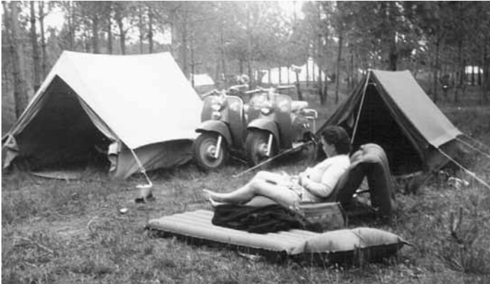
Dolce Vita - Ehepaar Wals in Venedig