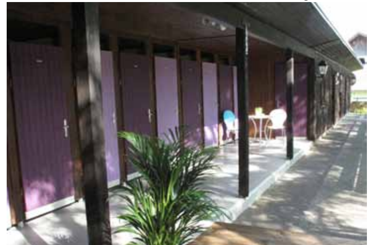
Das Wettebad lockt in Frühlingslaune pünktlich zur Badesaison. Den neuen Betreibern eine erfolgreiche Saison und - weiter so!