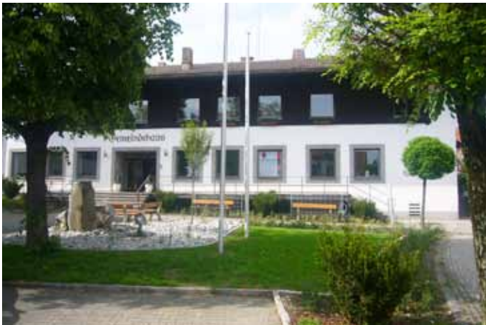
Gemeindegarten und Eingangsrampe in neuem Blickfeld. Vielen Dank an die ausführenden Firmen!