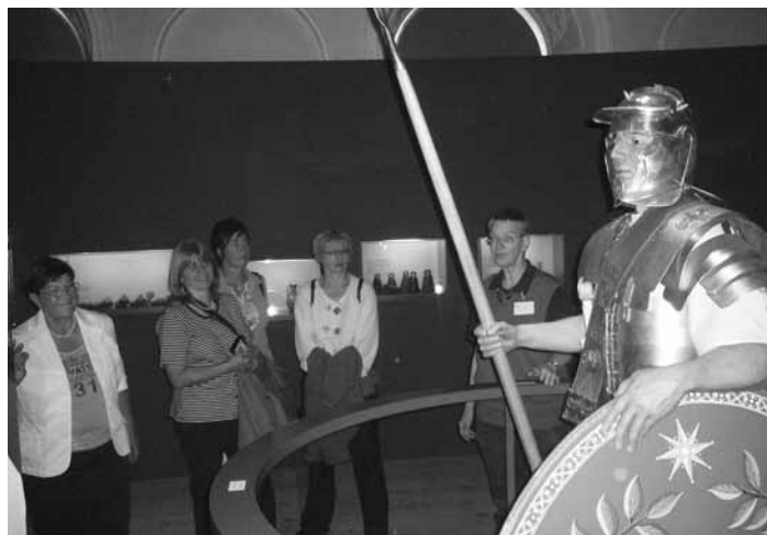
Führung durch die Landesaustellung im Kloster St. Mang