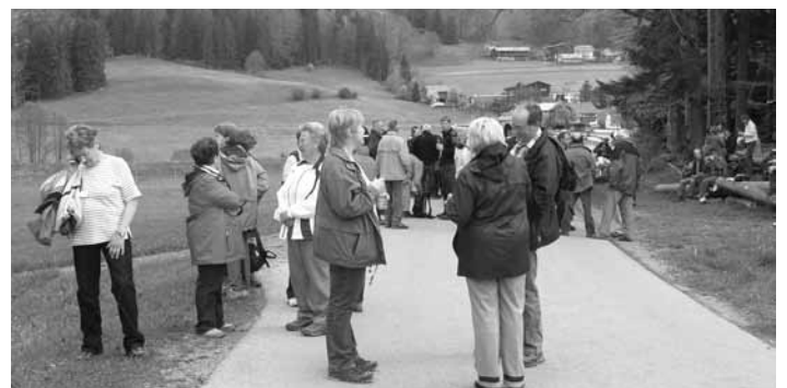
110 Roßhauptener nahmen an der Pfarrwallfahrt nach „Maria Hilf“, in Speiden teil.